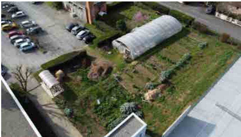
5- Situation du jardin partagé ADAS au 24 mars 2023