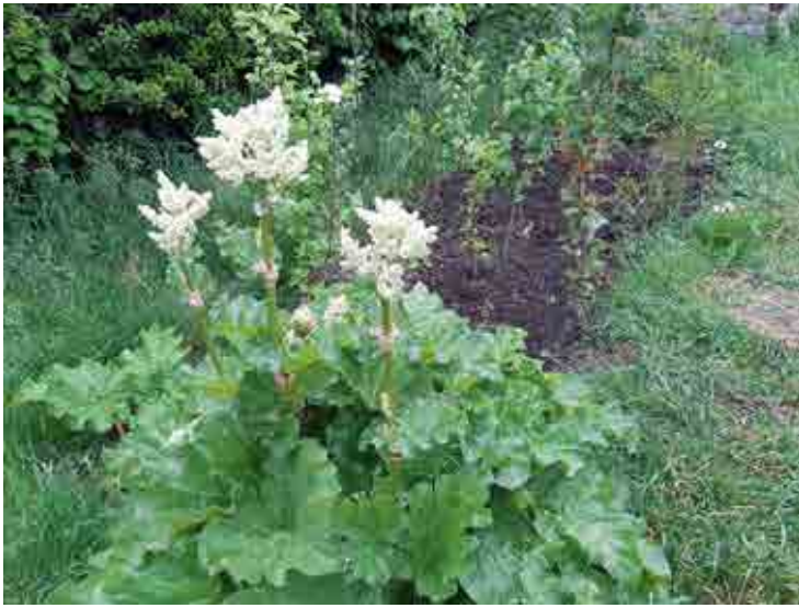
1- Rubarbe en fleur et pépinière de fruitiers gréffés