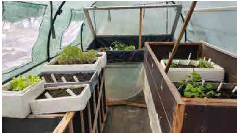
4- Serre et nurserie de jeunes plants à protéger des gels