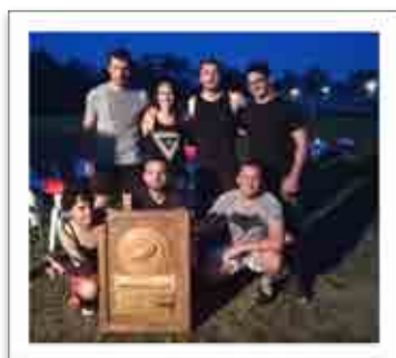
TOURNOI DU CNES