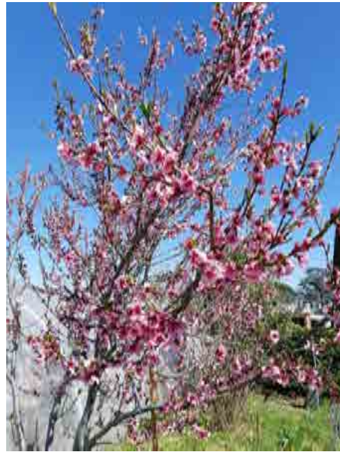
2- Floraison du pêcher sur la parcelle initiale