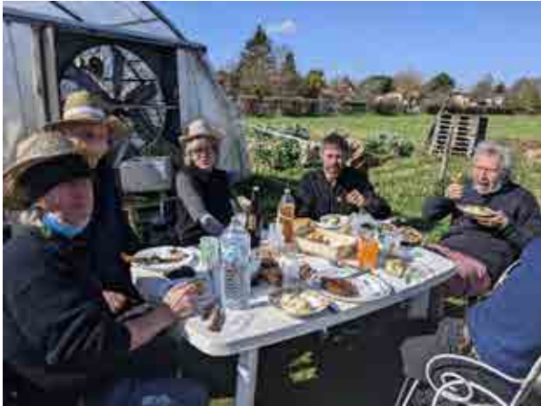
3- Pique-nique février 2022 matinaux